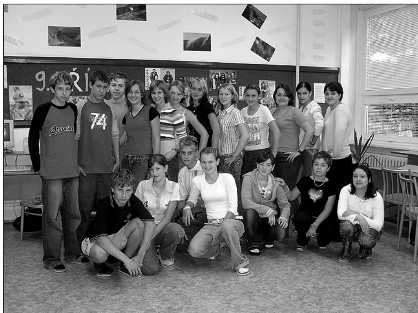
Žáci 9. třídy, kteří koncem června opustí naši školu.