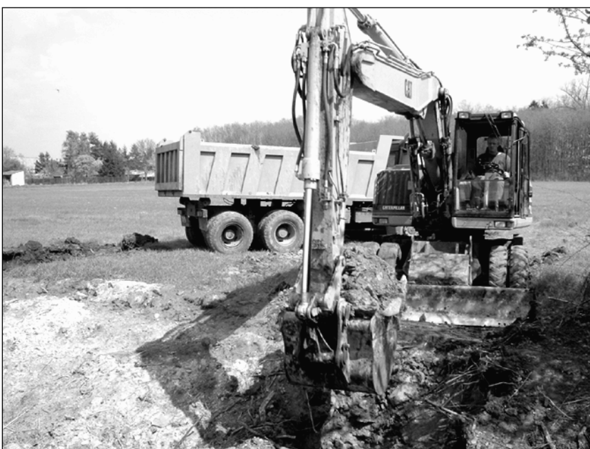
Práce na výstavbě inženýrských sítí pro 39 rodinných domů. Dosud je zmluveno na 33 parcel, 6 je ještě volných.

Lány 8, Kostomlaty nad Labem, tel. 723 607 150, 602 341 984