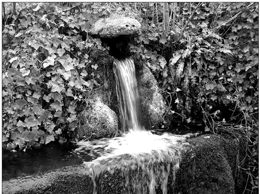
Červen mokrý a studený - bývají vždy žně zkaženy.