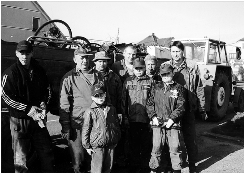
V sobotu 8. dubna uspořádali členové SDH sběr železného šrotu.